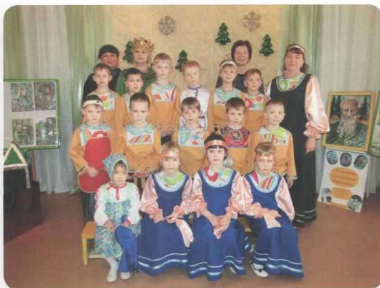
Участники театрализованного представления по произведениям П. Бажова

Так как план мероприятий предусматривает разные виды деятельности по ФГОС ДО, воспитатели МДОУ «Детский сад № 11 «Родничок»» подобрали материалы для продуктивной деятельности,